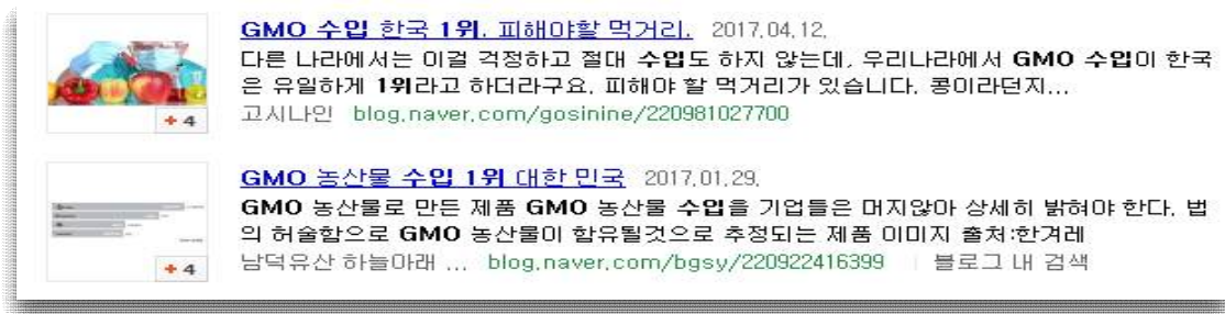
그림1. 블로그 내 유통되고 있는 GMO 수입 1위와 관련된 정보