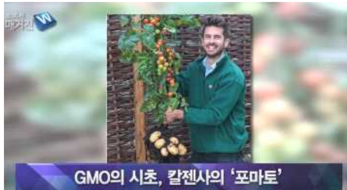
그림2. 언론에 노출된 잘못된 GMO 정보