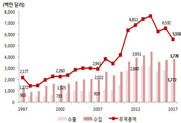
[그림 3] 북한의 대외무역총액 변화